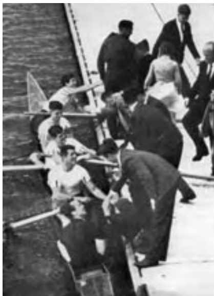
3 juni 1956

Uitgeselecteerd voor de eerstejaarsacht, was de Varsity de eerste echte wedstrijd voor deze overnaadse vier. De op gezag van praeses Kels gevaren trial om überhaupt te mogen starten werd overleefd. De Varsity werd tot ieders aangename verrassing overtuigend gewonnen. De volgende wedstrijden verliepen niet anders, en toen mochten ze het "glad" proberen, een hele promotie in die tijd. Vroeger, als je in je eigen veld had gewonnen, mocht je in hetzelfde weekend een niveau hoger starten. Met het verslag