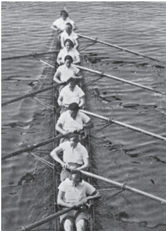
Ongeslagen stijlrace acht van 1935 met Eeftinck Schattekerk op nummer vier

Tot, men mag haast wel zeggen, verbijstering van vele mannelijke Nereiden, trouwde ze met een van de betere Njord-roeiërs. Als avuncula heeft ze haar band met Nereus echter altijd in stand gehouden.