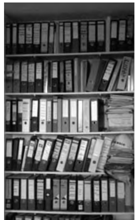
Kast met bestuursstukken in de bestuurskamer: rijp voor professionele archivering

plaats te doen belanden. Dit betekent ofwel in de kast (of kluis) in de bestuurskamer ofwel bij de collectie van het Universiteitsmuseum of het Gemeente Archief. Daarnaast zorgt de archiefcommissie dat de enorme hoeveelheid papieren en digitale stukken die het bruisende bestuurs- en commissieleven van Nereus voortbrengt voor de toekomst behouden en geordend blijft. Deze stukken zullen elke tien jaar aan de collectie van het Gemeente Archief toegevoegd worden om het wel en wee van de vereniging niet te doen laten vergeten. Tevens is de commissie bezig om alle overwinninglijsten te digitaliseren, aangezien een aantal oudere lijsten te lijden hebben onder de omstandigheden op Nereus en een plekje in het archief verdienen. Deze lijsten zullen op het botenhuis vervangen worden door prachtige replica’s.