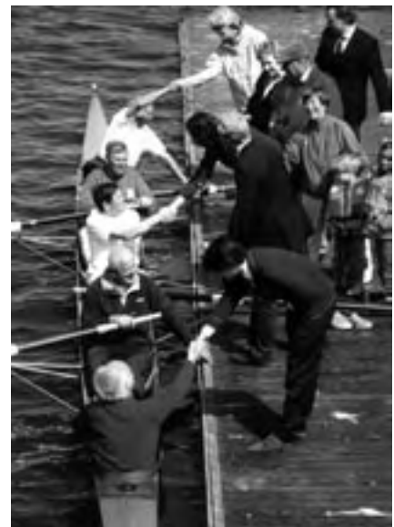
3 juni 2006

Op bladzijde 209 van het Gedenboek 1960 staat kort de onstuitbare reeks van overwinningen beschreven, culminerend in het Nederlands kampioenschap in de vier-met. Acht blikken in je eerste jaar, waaronder