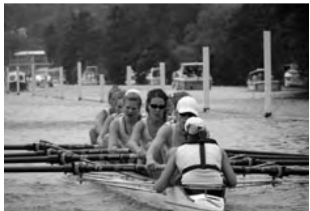
Middengroep dames op Women's Henley